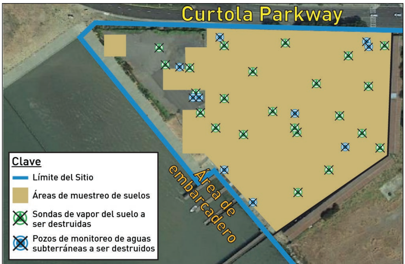
Figura 1 – Áreas de muestreo de suelos y pozos de monitoreo de aguas subterráneas/sondas de gas del suelo programadas a ser destruidas.